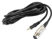
Cavo 1,5mt XLR femmina – Jack 3,5 a 3 poli