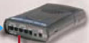
DIAL 200 collegato su 2 interni del Pabx