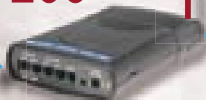
DIAL 200 collegato sul Fax