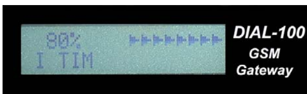
Ampio display LCD